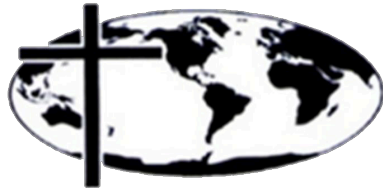
International College of Bible Theology